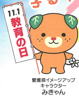
愛媛県イメージアップ キャラクター みぎやん